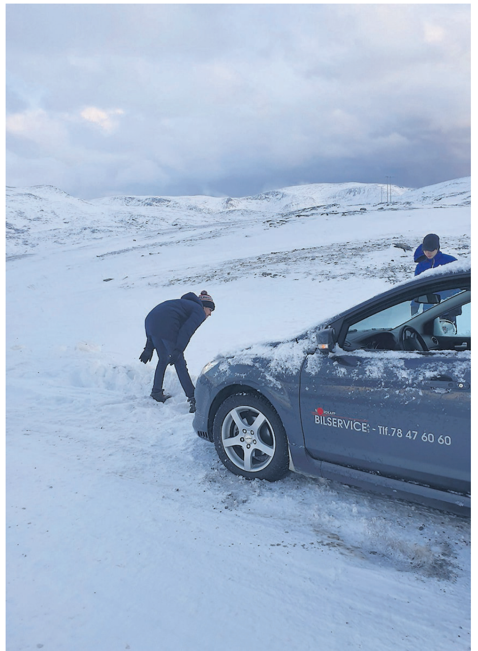
FINNMARK RUNDT: Ishålke og stiv kuling betød en aldri så liten tur i grøfta.

– Og her må jeg innrømme at jeg følte meg aldri så lite nostalgisk. Widerøe var en del av barndommen min, og det før-